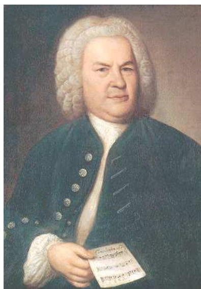
Joh. Seb. Bach (1685-1750)