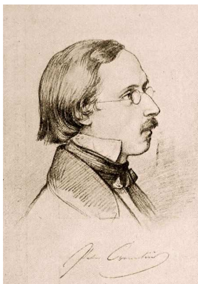
Peter Cornelius (1824-1874)